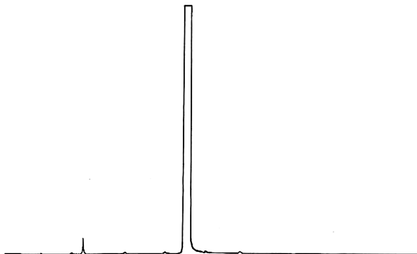
图 B.1 食品添加剂丁酸苄酯气相色谱图